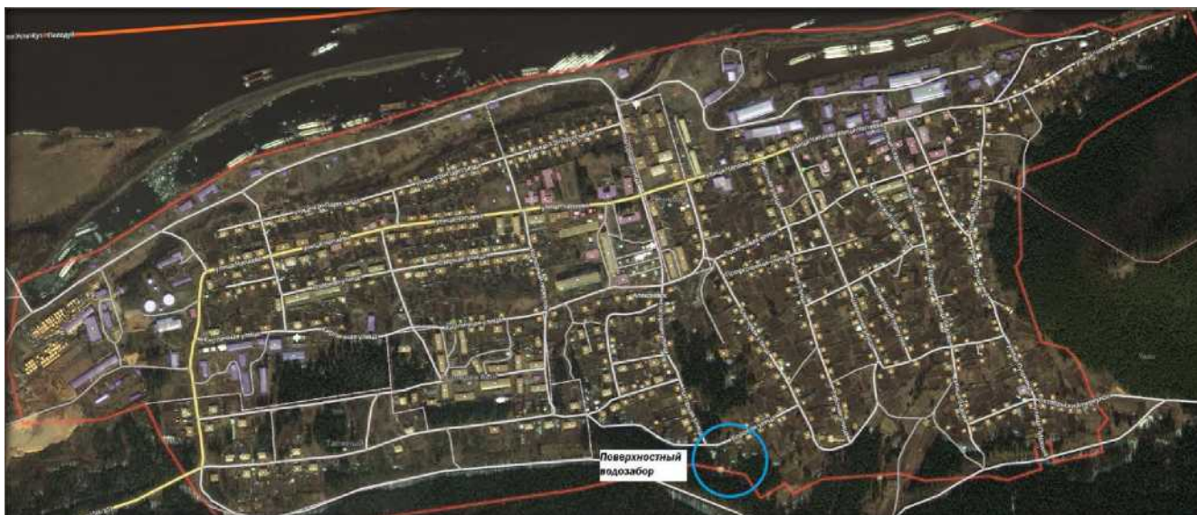
Рис. 1 - Зона водозабора от поверхностного источника