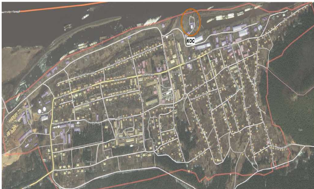
Рис. 2.1 - Расположение КОС