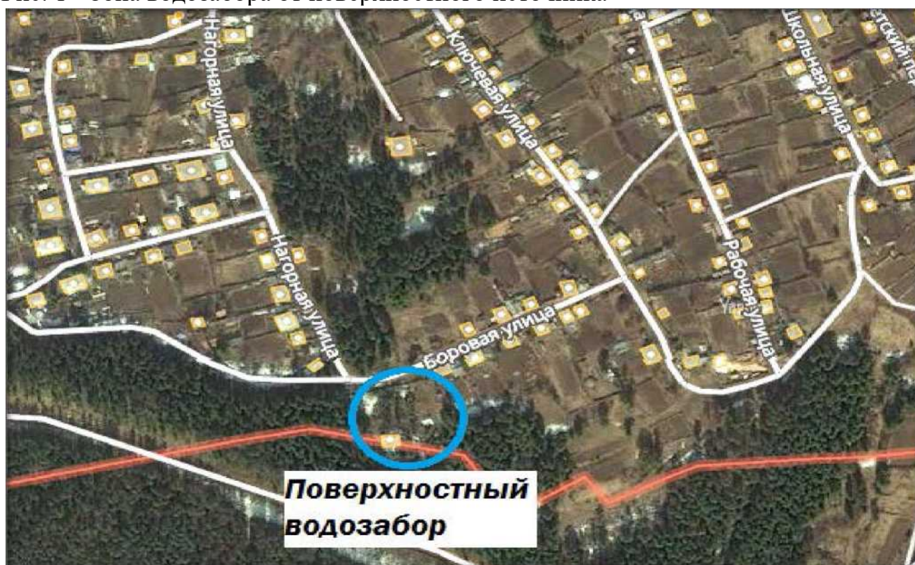
Рис. 1.1 - Зона водозабора от поверхностного источника

В д. Алексеевка и п. Воронежский, население снабжается водой за счет индивидуальных водозаборных скважин, шахтных колодцев, а также водой доставленной автотранспортом от поверхностных источников.